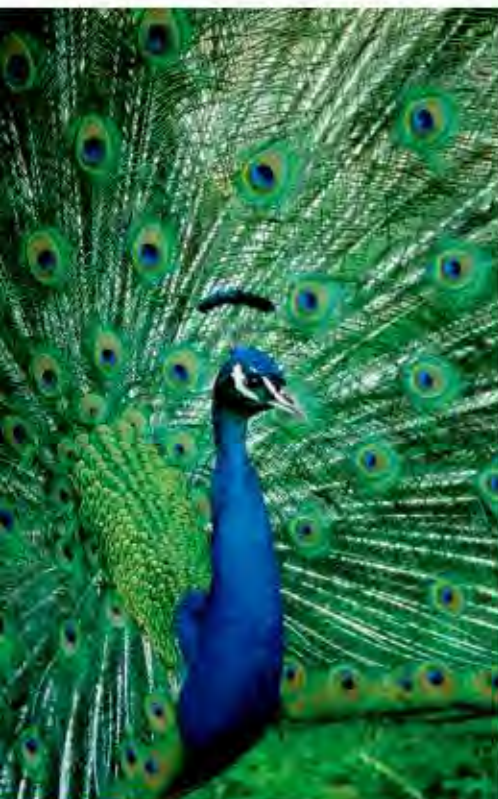
Fig. 1.2 El pavo real abre las plumas de su cola para formar un abanico, sacudirlas y así producir un susurro, señal de cortejo a una hembra.