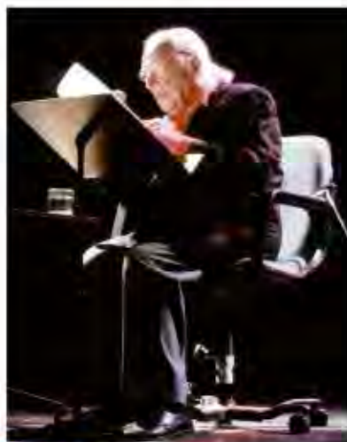
Fig. 1.1 Rafael Alberti leyendo un poema. El emisor de este acto de comunicación es el poeta, los receptores son los asistentes a la lectura poética, el mensaje es el texto que lee, el canal es la voz del poeta y el código es la lengua castellana.

Desde el CD podrás acceder a una página web donde encontrarás un resumen de la comunicación y los elementos que intervienen.