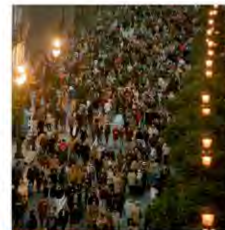
Fig. 1.3 En esta foto puedes observar el lenguaje corporal en una plaza de Sevilla muy concurrida.

Un caso muy especial es el lenguaje corporal de los seres humanos. La próxima vez que hables con alguien fíjate en los gestos que haces, si mueves las manos o las tienes quietas, la postura de tu cuerpo y lo lejos o cerca que te colocas de tu interlocutor. Te darás cuenta de que todo esto dice mucho de ti y de tu actitud en la conversación (si estás cómodo o incómodo con esa persona, si te gusta el tema del que habláis o no, etc.). También observarás que tu lenguaje corporal es distinto si hablas con un familiar, con un amigo o con un desconocido. Piénsalo: ¿a quién te acercas más?, ¿de quién te colocas un poco más lejos?